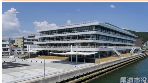
尾道市役所 本庁舎